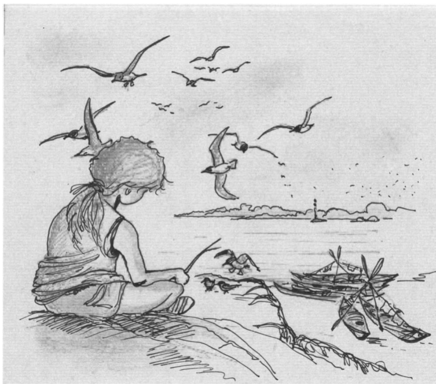
Dessin Philippe Bret

CK/mer (Connaissance du kayak de mer) www.ckmer.org