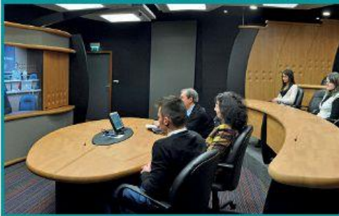
Salle de téléprésence immersive