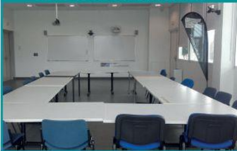
Salle de télé-enseignement