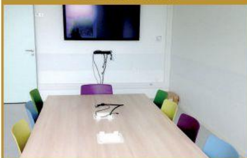
Salle de réunion