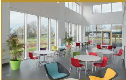
Salle de réception