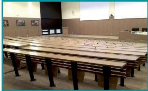
Salle de télé-amphithéâtre