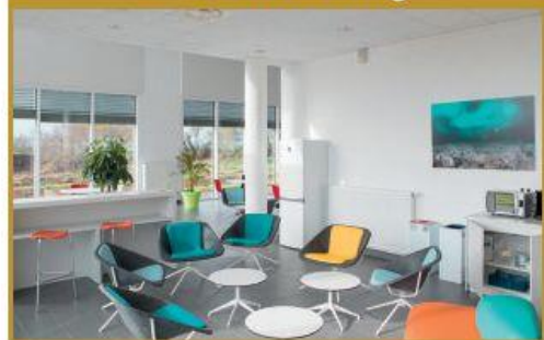
Salle de coworking